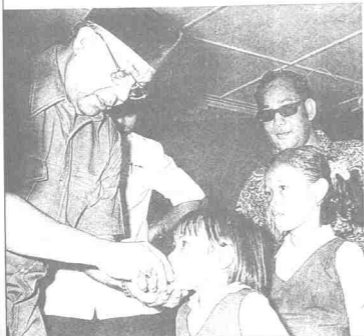
Utusan Melayu (UM); 11 Jun, 1997.

متری بسر قاهغ، داتوه یچی منیاس دیری سمیون مرپاه اوله فارا فدودوق کیک بلیا برکوخوغ کدایره-دایره دنکری ایت.