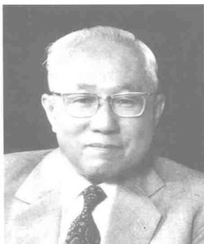
TAN SIEW SIN

menjawab surat Tan Siew Sin itu dengan mengatakan bahawa saya ada menghubungi beliau melalui telefon meminta komen beliau mengenai keputusan UMNO tentang perantikan tokoh Melayu sebagai Gabenor yang pertama Negeri Melaka.