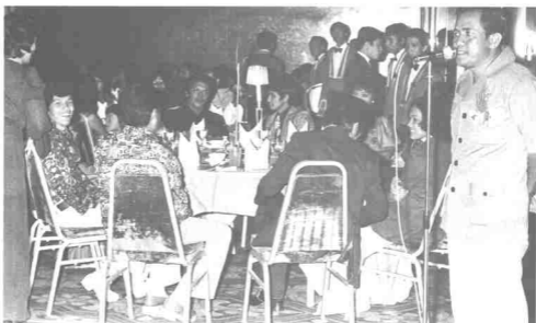
Penulis sedang berucap di majlis makan malam anjuran Badan Keluarga Utusan Melayu yang diadakan di Hotel Hilton (sekarang Hotel Nirwana) Kuala Lumpur pada tahun 1976.