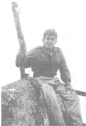
Penulis bergambar di puncak Gunung Ledang.