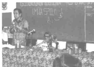
Penulis sedang berucap pada satu majlis ceramah yang diadakan oleh sebuah cawangan MAYC di Negeri Kedah. Ketika menjadi Ketua Pengarang Bintang Timur pada tahun 1980.