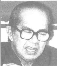
داتوۋ مزلن نوردین

قد ساتو هاری اخیر بولن جانواری، 1980 سای تله دفنگکل ماسوق کیلیق کوا لغارغ