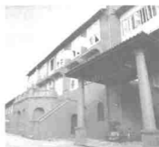
The Stadthuys dibina dalam tahun 1650 sebagai rumah penginapan dan pejabat rasmi Gabenor Belanda. Kini, bangunan ini dijadikan sebagai muzium dan pelbagai khazanah lama turut dipamerkan termasuklah pelbagai pakaian traditional Melaka.