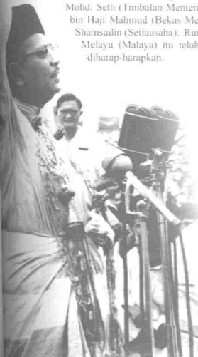
Pelikan "MERDEKA" oleh Tunku Abdul Rahman di Padang Bandar Hilir, Melaka.

Sambutan kepulangan Rombongan Menuntut Kemerdekaan itu bermula di Lapangan Terbang Batu Berendam. Tunku dan rombongannya telah diarak dan diiringi berpuluh-puluh motosikal