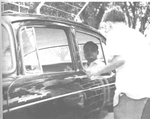
Penulis sedang bertanyakan sesuatu kepada Ketua Menteri, Ghafar Baba yang hendak keluar dari Maktab Perguruan Perempuan Melayu di Durian Daun kerana menyiasat berita pelajar-pelajar Maktab tersebut melancarkan mogok.