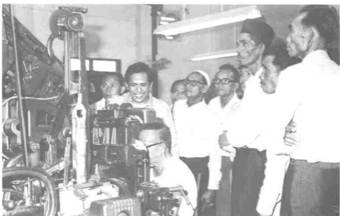
Penulis sedang melayani pelawat melawat Ibu Pejabat Utusan Melayu di jalan Chan Saow Lin di Kuala Lumpur.