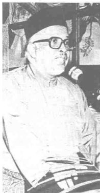
اشرحیم دائره عصري

ريضاءالدين، دائره دوكتور عزيز عمر دان راماي لاکي. سوقو ساي برخمدت دکلتن، کيولن تفکو ززالي بارو سهاج باليق دري لندن کوان کماين ايپن تفکو حمزه، بلياو ماس ايت بلوم بکيو ترکل، تالي مروفاکن ساورغ توکوه مودا يغ ساعت برفونسي اونوق منجادي لميشين امنو نکري کلنتن. بلياو ساورغ توکوه مودا يغ سوک مرندہ ديري دان مفويماي فرکاءولن دغن سوا فيق، والو فون برکورون کلوارگ بفساون، تالي تفکو ززالي تيدق سوموغ. سوا اورغ سنغ هاتي بردمشين دغن.