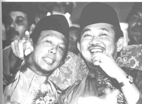
Tan Sri Musa Hitam bersama Tengku Razaleigh Hamzah