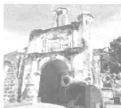
A' Famosa merupakan mercu tanda Melaka. Dibina oleh Portugis pada tahun 1511 sebagai pertahanan tetapi sebahagiannya telah musnah semasa peraklukan Belanda. Namun bangunan ini diselamatkan kembali oleh Sir Stamford Raffles.

Saya telah menulis dalam Utusan Zaman keluaran 30 April 1961 berjudul “Kalau Roboh Kota Melaka.....”. Saya menentang dengan mengatakan usul tersebut tidak bijak dan akan merugikan Melaka, terutama dalam usaha untuk menarik pelancong.