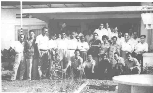
Rombongan wartawan Malaya bergambar kenang-kenangan di depan rumah Allahyarham Datuk Senu Abdul Rahman, ketika itu Duta Besar Malaya ke Indonesia. Penulis paling kiri duduk bertenggang.

Ada satu peristiwa yang tidak dapat saya lupakan dalam lawatan tersebut. Kapal terbang yang bertolak dari lapangan terbang Changi, Singapura membawa kami ke New Zealand telah singgah di Lapangan Terbang Sydney untuk mengisi minyak. Kira-kira sepuluh minit dalam perjalanan menuju ke Lapangan Terbang Auckland, tiba-tiba berlaku keadaan kelam kabut. Saya melihat anak-anak kapal cemas dan berulang alik dari depan ke belakang dan sebaliknya.