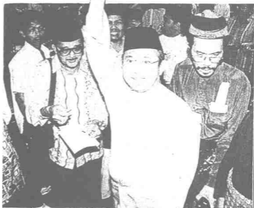
تفکو رزالی حمزه: ایت دسغی اوله رحمة کلتن.

ساي برتوگس کلکنن تیدق لاما. دزی بولن می هیفک بولن شیخیر، 1965. کیرا لیم بولن. تنافی سرونوق برتوگس دنکری یغ ترکل جوگ دغن کلرن سرمی مکه دان چیق سیتی وان کیمغ، ملیهی درفد سرونوق ساي برتوگس سلاما لافن تاهون دملاک.