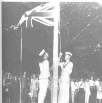
Bendera Union Jack diturunkan buat kali terakhir dan digantikan dengan bendera Persekutuan Tanah Melayu.

Di Padang Pahlawan ini juga telah menyaksikan bagaimana hebatnya pahlawan-pahlawan Melayu Melaka memberi tentangan terhadap pencerobohan penjajah Portugis pada tahun 1511.